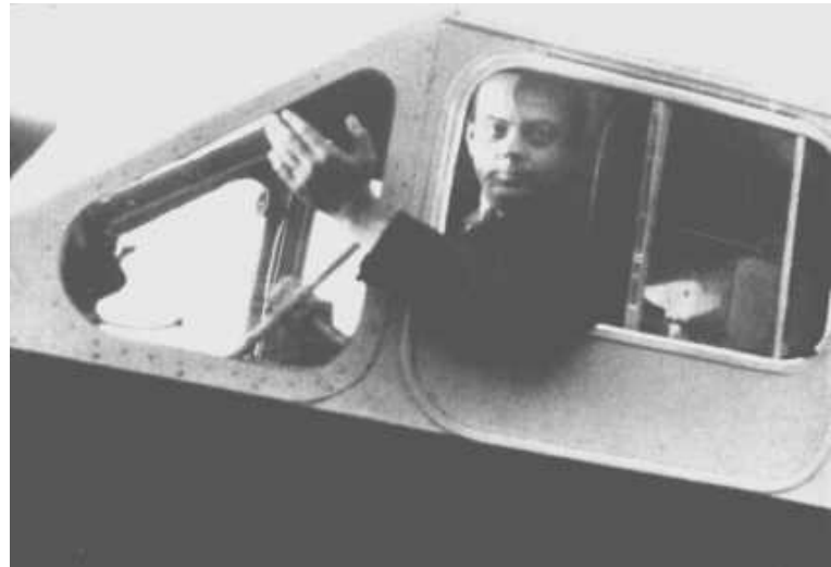
El escritor en uno de sus aviones. Voló sobre el Sahara, sobre los Andes y fue piloto de guerra.

el 29 de junio de 1900 y quedó huérfano de padre e a los cuatro años. Su madre pasó a ser clave en su vida de aristócrata empobrecido y nómade. Del castillo pater no se mudó al de sus tías por la ruina económica, mientras Saint-Exupéry acumulaba retos de los jesuitas no sólo por su "horros ortografía" sino por su indisciplina, sus distr acciones y la impenitente costumbre de escribir en papelucho sus poesías combinadas con dibujos que nada tenía que ver con la clase. A partir de 1919, después de un campo de aviación o intento de ingreso a la Escuela Naval, pasó 15 meses estudiando dibujo en Bella Artes y dos años más tarde fue alistado como soldado en un campo de aviación del ejército. Allí se las arregló para tomar clase de pilotaje en secreto. Quedó maravillado: veía al mundo desde otra perspectiva, diferente de la de los demás. En la estrecha carlinga nes, en lucha contra los elementos desastrosos, el aristócrata se descubrió a sí mismo, forjó concepto del deber y la responsabilidad, y alimentó el ideal humano. Poco después de terminar inad Guerra Mundial, Saint-Exupéry se comprometió con Louise de Vilmorin, una joven hermosa, , de un avio